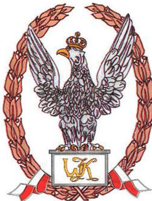
Odznaka Liceum Kadetów Rzeczypospolitej Polskiej (wym. 310X362)